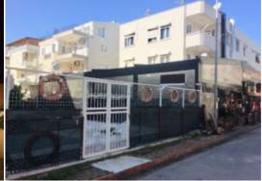
Resim 3: Konutun arka

*Son yirmi yıldır aynı alanda yapılan uygulamalar göstermiştir ki, (buna geçtiğimiz yaz yapılan geçici ünitelerde dahildir.)tüm üniteler kısa sürede tüm tepkilere rağmen genişlemekte ve farklı işlevlere dönüşmektedir. (Resim 4)