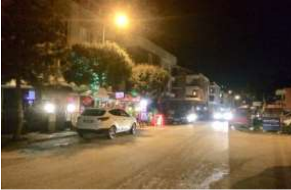
Resim 2:Trafik uygulaması yapılacak sokakta fiili durum. bahçesinde meyhane

*Konyaaltı'nda böyle bir projenin yapılacağı açıklanmasıyla kentsel dokuda dönüşüm hızlanmıştır. Kıyadaki plan değişiklikleri dışında yeni trafik düzeni önerileri getirilen sokaklarda hızlı ve yasal olmayan dönüşümler başlamıştır. Sadece konut giriş katlarında değil, bodrum katlarda hatta konut arka bahçelerinde restoran, kafe, bar vb. mekanların açıldığı ve bu mekanların önlerinin ve çevresinin, tüm Antalya'da, kıyılarda alıştığımız ve son zamanlarda mafyalaşan “vale çeteleri” tarafından kontrol altına alındığı görülmektedir. (Resim 2-3)