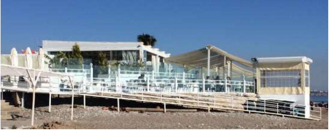
Resim 4: 2017 yazı için yapılan “geçici” plaj ünitelerinden birisi. %100’ün üzerinde büyüme.

*Yarışma şartnamesinde yer almayan Boğaçayı Projesi ile yarışma alanı ikiye bölünmüştür. Taslaktan da anlaşıldığı gibi proje fiilen Boğaçayı’nın doğusunda sonlandırılmaktadır.