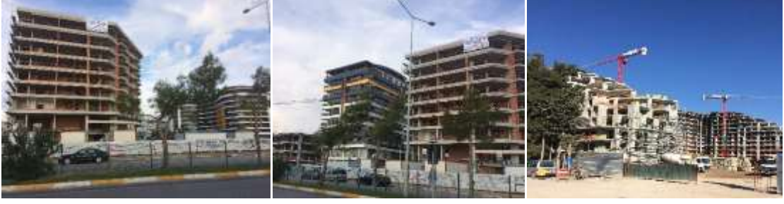
Resim 1: Akdeniz Bulvarı'nda 2016 plan kararlarıyla oluşan yapılaşmadan ilk örnekler.

*Konyaaltı'nda böyle bir projenin yapılacağı açıklanmasıyla kentsel dokuda dönüşüm hızlanmıştır. Kıyadaki plan değişiklikleri dışında yeni trafik düzeni önerileri getirilen sokaklarda hızlı ve yasal olmayan dönüşümler başlamıştır. Sadece konut giriş katlarında değil, bodrum katlarda hatta konut arka bahçelerinde restoran, kafe, bar vb. mekanların açıldığı ve bu mekanların önlerinin ve çevresinin, tüm Antalya'da, kıyılarda alıştığımız ve son zamanlarda mafyalaşan “vale çeteleri” tarafından kontrol altına alındığı görülmektedir. (Resim 2-3)